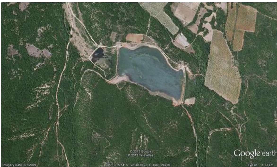
Слика 3. Сателитски приказ на акумулацијата Црничани