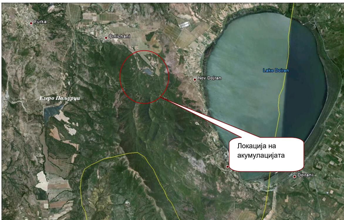
Слика 2. Сателитски приказ на акумулацијата Црничани